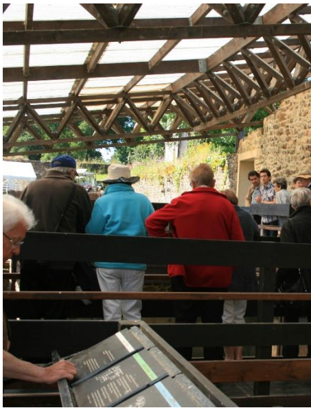
Visite du site archéologique

Les journées de l'archéologie seront l'occasion de rencontrer quelques acteurs de l'archéologie de demain.