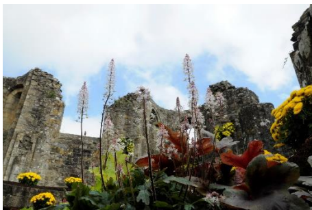
Jardin d'automne, fleurissement des ruines

Les élèves paysagistes du Lycée horticole de Châteaulin adoptent les ruines de l'abbaye pour créer une composition éphémère originale et colorée de plantes et de légumes d'automne. Des visites guidées et des ateliers pour les enfants seront proposés pendant toutes les vacances.