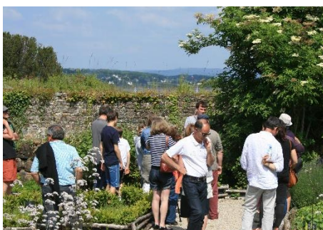
Visite du jardin médiéval de l'Ancienne abbaye