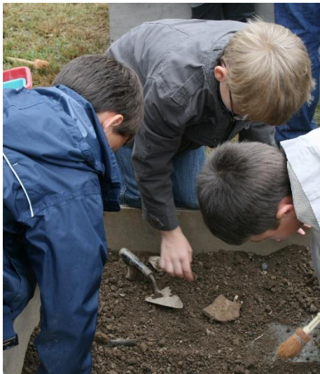
« L'apprenti archéologue », l'Histoire à la truelle et au pinceau