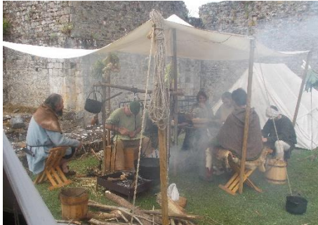
La troupe de reconstitution historique LETAVIA